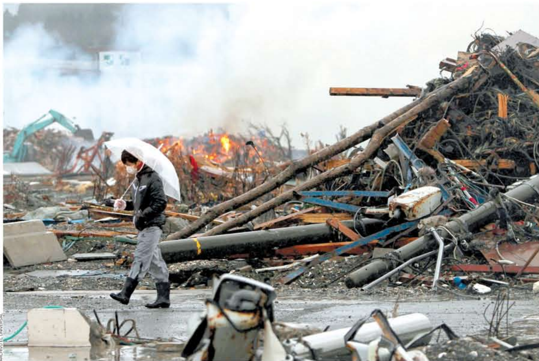
MUY ÚTILES. Con estas herramientas se podrán prevenir y reducir pérdidas humanas y económicas