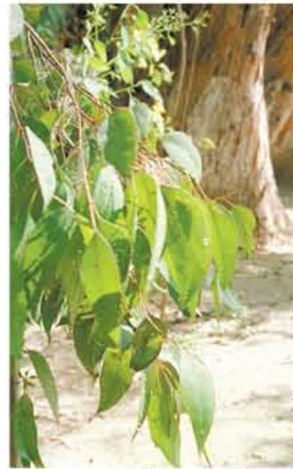
PLAGAS. Para evitarlas requieren podas de formación o sanitarias