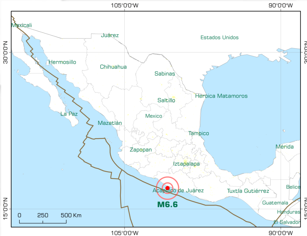
Figura 2. Placas tectónicas y ubicación del epicentro del sismo de 6.6 grados del 08 de mayo del 2014 (datos del SSN)

Elaboró: Sandra Rosio Quiroga Cuéllar (sandra_quiroga@ern.com.mx)