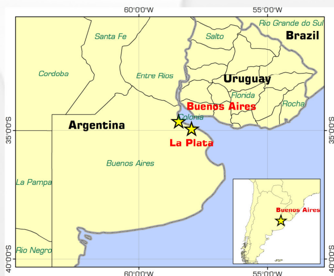
Figura 1. Ubicación de Buenos Aires y La Plata, zonas más afectadas