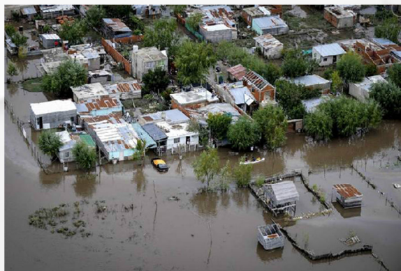
Figura 2. Vista aérea de las inundaciones en Buenos Aires.

Los municipios conurbanos de La Matanza y San Martín pertenecientes a la Provincia de Buenos Aires, también se vieron afectadas.