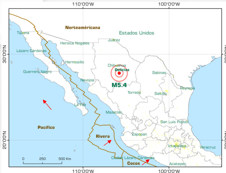
Ubicación del epicentro del sismo del 21 de septiembre del 2013 de acuerdo al SSN

Elaboró: Sandra Rosio Quiroga Cuéllar ( sandra_quiroga@ern.com.mx )