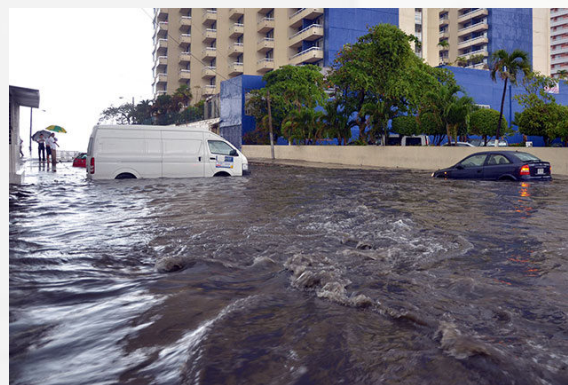
Figura 5. Las alcantarillas de la Costera Miguel Alemán no fueron suficientes para canalizar las lluvias que se presentaron durante el paso del Huracán Bárbara.

En el punto conocido como El Derrumbe , un deslave de rocas y lodo invadió parte del carril de la carretera Mozimba-Pie de la Cuesta.