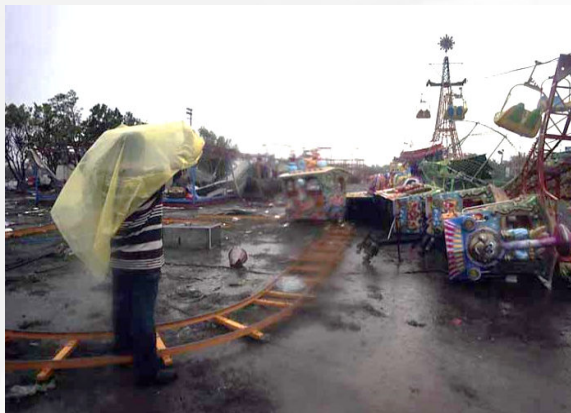
Figura 3. Arriaga, es uno de los municipios de Chiapas que reporta mayor cantidad de afectaciones.