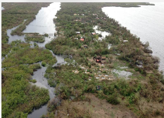
Figura 4. Cerca de 300 habitantes de Cachimbo fueron rescatados por aire y mar debido a la inaccesibilidad al lugar.

Una de las poblaciones más afectadas fue Cachimbo , perteneciente al municipio de San Francisco Ixhuatán, donde debido a los daños observados se decidió reubicar a toda la población, integrada por unas 300 personas y que se ubica en una pequeña península del Golfo de Tehuantepec. En esta zona, el agua inundó por completo la pequeña península, lo que ocasionó que las viviendas de paja y láminas se destruyeran.