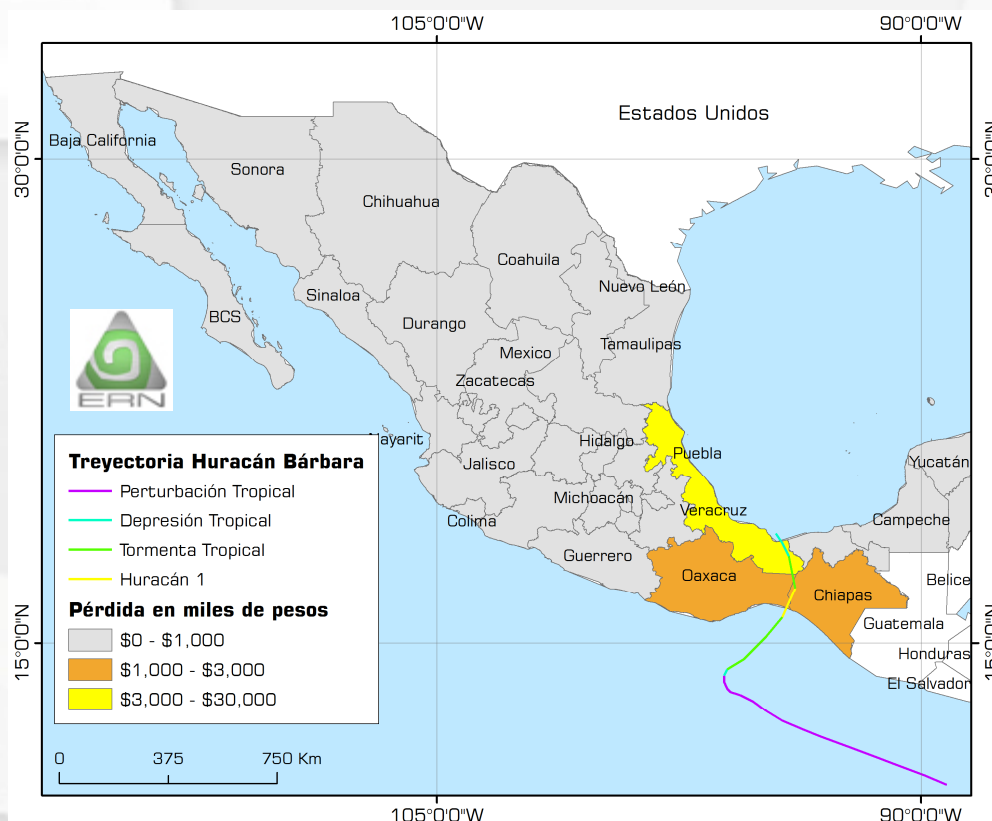
Figura 1. Estados con las mayores pérdidas ocasionadas por el Huracán Bárbara, tomando como base una cartera representativa del sector asegurador y evaluada con el Sistema RH-Mex.

Resultados considerando una cartera que pudiera estimarse representativa del sector asegurador.