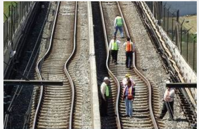
Figura 4. Daños en los rieles de la Línea A del metro

El movimiento sísmico ocasionó que La línea A del Metro sufriera deformaciones en sus rieles en las estaciones Peñón Viejo, Acatitla, Santa Martha, Los Reyes y La Paz (Figura 4).