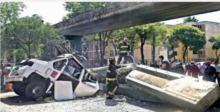
Figura 3. Parte de un puente peatonal se colapsó en la delegación Azcapotzalco

En Azcapotzalco cayó parte de un puente peatonal sobre un camión de la ruta 26 del Estado de México (Figura 3).