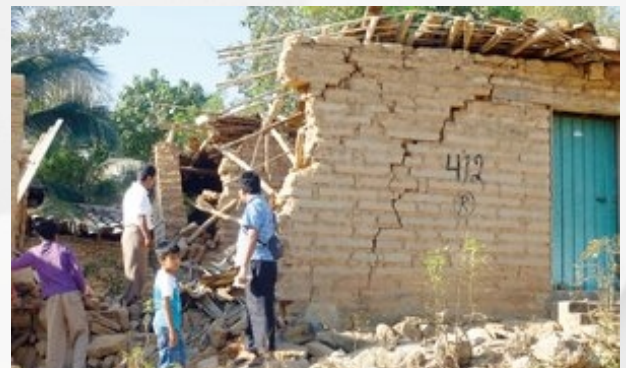
Figura 5. Viviendas dañadas en el estado de Guerrero

El gobernador del estado, Ángel Aguirre Rivero, informó que se contabilizan 30 mil viviendas afectadas en 28 municipios; 800 con pérdidas totales, principalmente viviendas precarias (Figura 5).