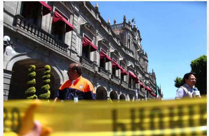
Figura 7. El Palacio Municipal de Puebla, presentó algunas grietas por el sismo, por lo que fue evacuado.

El estado de Puebla diversas estructuras se vieron afectadas, como el Palacio Municipal (Figura 7).