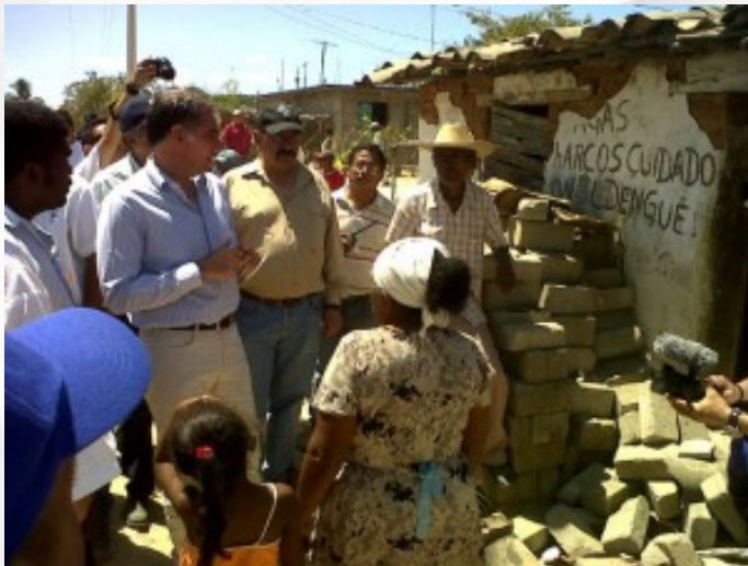
Figura 6. Daños en viviendas en Oaxaca.

En la Figura 6 se observa el tipo de daño que sufrieron las viviendas en algunas comunidades de Oaxaca.