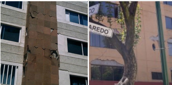
Figura 2. Edificios del Distrito Federal dañado por el sismo

Los daños en edificios de la ciudad de México se limitaron a caída de fachadas tal como sucedió en la colonia Condesa. (Figura 2)