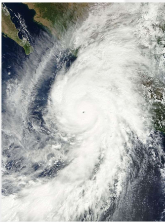
Figura 2. Imagen de humedad del Huracán Patricia unos días antes de convertirse en el más potente jamás registrado.