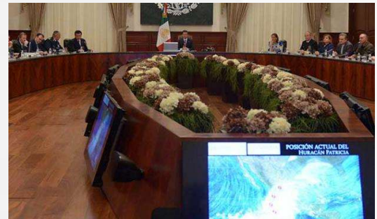
Figura 3. Reunión de emergencia del gabinete del Presidente Enrique Peña Nieto ante el inminente impacto de Patricia.