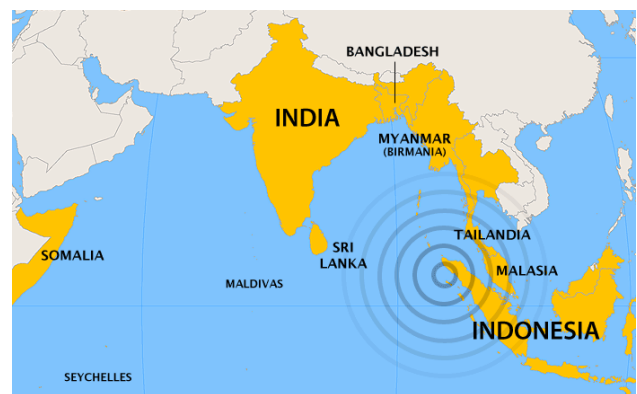
Figura 2. Zona del epicentro del sismo de 9.0 grados y países afectados

Múltiples tsunamis golpearon las regiones costeras del Océano Índico devastando regiones enteras, incluida la isla de Phuket en Tailandia y las costas de Indonesia , Sri Lanka y la India , e incluso en lugares lejanos como Somalia , a 4,100 km al oeste del epicentro. En la Figura 2 se muestra la zona del epicentro del sismo de 9.0 grados y algunos países afectados.