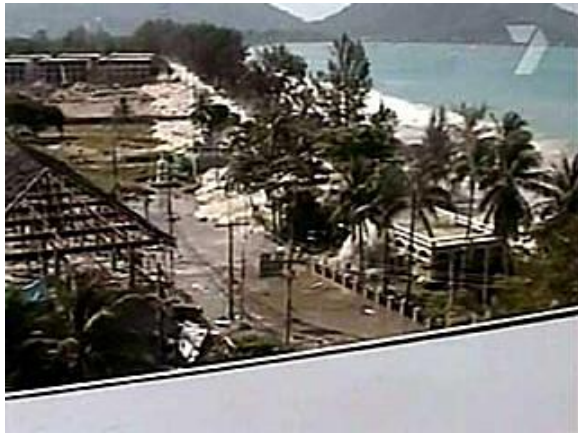
Figura 3. Foto de tsunami presentado en la Isla de Phuket (Tailandia) el 26 de diciembre de 2004

Un tsunami o maremoto es una onda en el mar generada por el desplazamiento vertical del fondo marino . Esta onda viaja a grandes velocidades en el océano (800 km/h) perdiendo su configuración al llegar a las costas lo que provoca marejadas y olas en ocasiones mayores a las provocadas por los fenómenos hidrometeorológicos. Mientras se desplazan por aguas profundas, las ondas de los tsunamis son de gran longitud (cientos de kilómetros) y muy pequeña altura (centímetros). Por ello, son indetectables desde embarcaciones y aviones , y solo pueden ser medidas con mareógrafos que desafortunadamente no existen en el Océano Índico (si existen, por ejemplo, en el Pacífico).