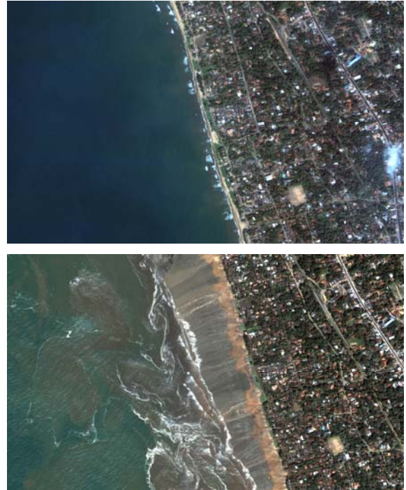
Figura 4. Foto satelital que muestra el estado normal de la playa en la costa de Kalurata (Sri Lanka) y el descenso del mar presentado el 26 de diciembre de 2004

Fuego". En esta zona los gobiernos y pobladores están mejor preparados y en algunos países cuentan con sistemas de alerta contra estos fenómenos. Al parecer el gran sismo de Lisboa del siglo XVIII provocó fuertes maremotos en el Caribe.