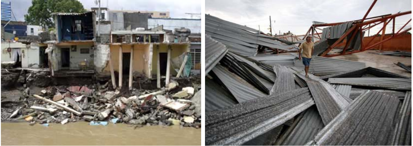
Figura 2 Daño por el huracán Dean en Veracruz

plátano, cítricos, vainilla y maíz, cuyas plantaciones fueron quebradas o arrancadas por los vientos de más de 150 kilómetros por hora que impactaron a Veracruz. En San Rafael se perdió por completo la producción de plátano, destinada principalmente para el mercado de los Estados Unidos. También se perdieron cultivos de limón y naranja.